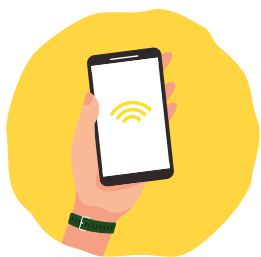
L'APLICACIÓ PER A MÒBILS CIVIWASTE

Per obrir-los cal utilitzar una d'aquestes dues opcions: