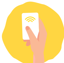
LA TARGETA IDENTIFICATIVA

Ambdues estan vinculades a cada domicili per mitjà d'un codi únic. Els comerços només poden fer servir l'opció de la targeta.