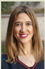
Núria Parlon. Alcaldessa de Santa Coloma de Gramenet

«Metròpolis Verda» aporta una nova mirada perquè Santa Coloma no és només un conjunt d'edificis i carrers, ciment i asfalt; sobretot és un territori sostenible amb espais verds urbans i no urbans, que componen una infraestructura verda connectada amb valors ambientals, socials i fins i tot econòmics.